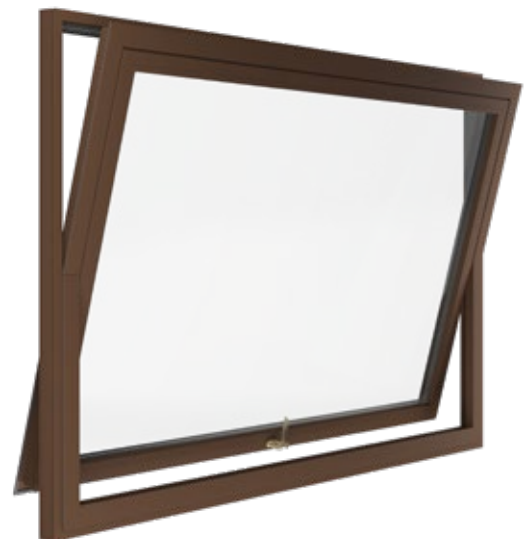
Bilico aperto vista laterale