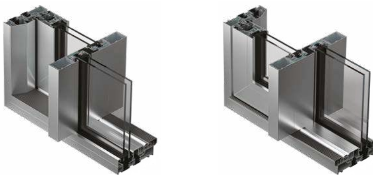
ASE 60 vista interna ed esterna