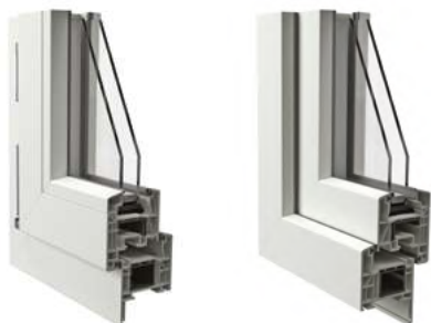
Telaio ad Elle con cornice da 30 mm vista interna ed esterna