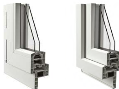
Telaio a Zeta da 50 mm vista interna ed esterna