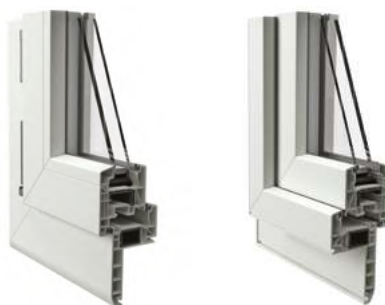
Telaio a Zeta da 75 mm vista interna ed esterna

Disponibile esclusivamente nelle colorazioni: WS Bianco in pasta e GO Golden OAK