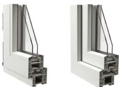
Telaio ad Elle con cornice da 30 mm vista interna ed esterna