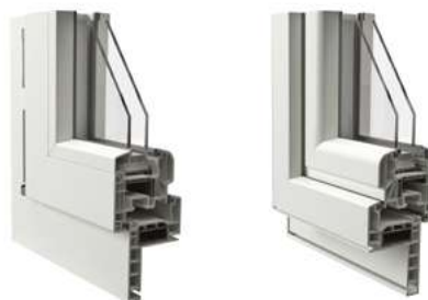
Telaio a Zeta da 58 mm vista interna ed esterna Esempio con anta arrotondata