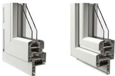
Telaio a Zeta da 38 mm vista interna ed esterna Esempio con anta arrotondata